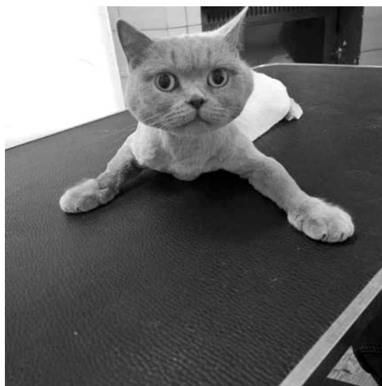
Naminių gyvūnų kirpyklos klientai. Kai kurie jų ne tik mėgaujasi grožio procedūromis, bet ir mielai pozuoja fotografui.

„Kirpyklos atidarymas vyko eksromptu, apie jos atidarymą aš net ir nesvajojau. Tiesiog išgijome jorkšyrų terjerų veislės šunelį vardu Gilė. Tuo metu namuose auginau mažą vaiką ir galvojau apie tai, kad noriu užsiimti kažkuo kitu, nebeneriu dirbti socialine darbuotoja. Išėjau iš darbo, tapau bedar-