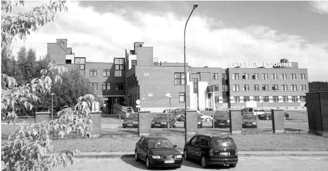
Anykščių ligoninėje, pasak ataskaitos, trūksta septynių gydytojų, todėl pacientai nesulaukia reikalingos medicininės pagalbos.

Anykščių rajono taryba ataskaitai nepritarė.